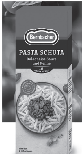
Abb. 3. PASTA SCHUTA Bolognaise Sauce und Penne von Bernbacher ( https://www.bernbacher.de/de/produkt/pasta-schuta/pasta-schuta ).

Ein interessantes Phänomen zeigt sich bei der Gemüsesorte zucchini [dʒuk'kini] (deutsch: [tʃu'ki:ni]). Die Graphemfolge <ch> in der phonologischen Realisation /k/ kennt keine deutsche Entsprechung und wird im Fall von „Zucchini“ bisweilen fälschlicherweise Zuckini geschrieben.