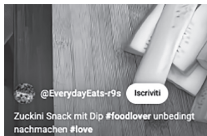
Abb. 4: Zuckini Snack im Internet ( https://www.youtube.com/shorts/0AgjhRadPOQ ).

Ein interessantes Phänomen zeigt sich bei der Gemüsesorte zucchini [dʒuk'kini] (deutsch: [tʃu'ki:ni]). Die Graphemfolge <ch> in der phonologischen Realisation /k/ kennt keine deutsche Entsprechung und wird im Fall von „Zucchini“ bisweilen fälschlicherweise Zuckini geschrieben.