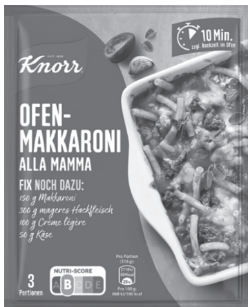
Abb. 1. OFEN-MAKKARONI ALLA MAMMA ( www.knorr.com/de ).