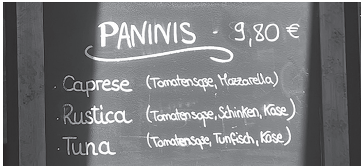
Abb. 6. PANINIS im Aushang eines deutschen Speiselokals.

Deutsche panini ein Singular zu sein, es sich jedoch um den italienischen Plural von panino handelt. So ist Paninis eine häufig anzutreffende Hyperkorrektur deutscher Pluralmarkierung. Ähnlich oft findet man Gnocchis , Canellonis , Spagettis/Spaghettis , Zucchinis etc., jeweils dem Muster der deutschen Suffigierung (-s) folgend.