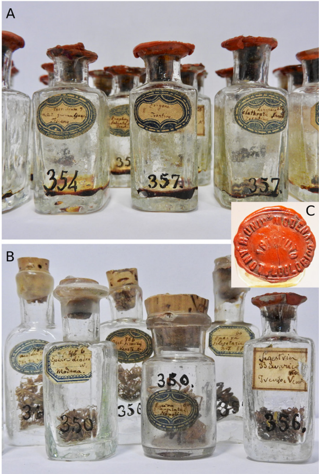
Fig. 2 - La collezione aracnologica di Canestrini include attualmente campioni in condizioni di cattiva conservazione (A), ma la maggior parte degli esemplari sono ben conservati (B). Moltissimi campioni portano ancora il sigillo originale con cui erano stati preparati (C). Museo di Zoologia dell'Università di Modena e Reggio Emilia.