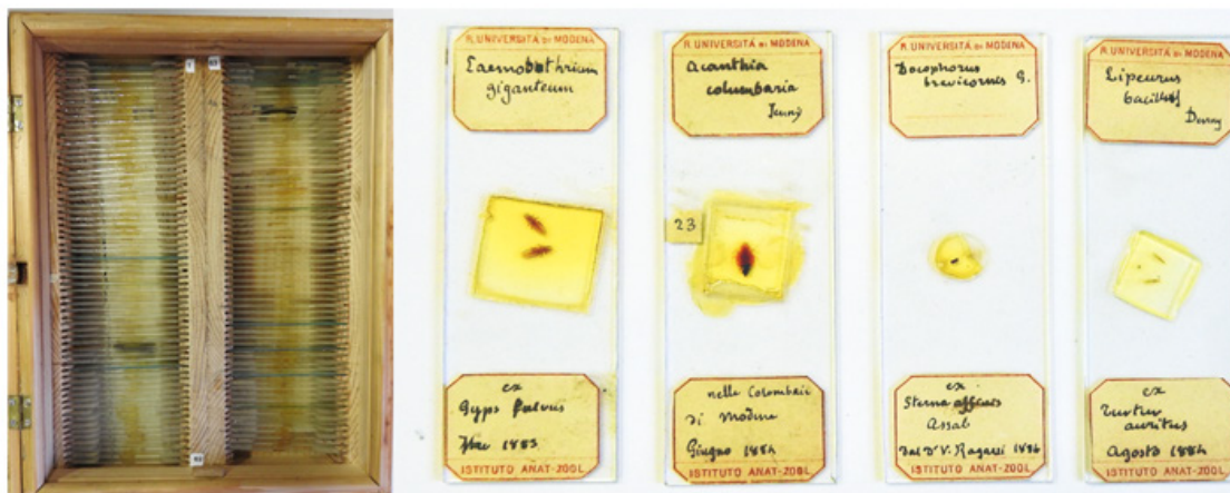
Fig. 4 - La raccolta acarologica Canestrini è risultata essere in realtà costituita da vetrini con preparati di insetti parassiti campionati tra il 1881 e il 1886. Museo di Zoologia dell'Università di Modena e Reggio Emilia. Fotografia di Mauro Mandrioli.

mente della tarantola e del malmignatto, appunto perché questi, creduti assai dannosi, dovevano destare in loro maggiore curiosità. In seguito, impresso il movimento a tutte le scienze, anche l'araneologia ne risente e si apre una nuova era di studi più positivi. [...] Infine, si potrà domandare come si comporti l'araneologia di fronte alla teoria del Darwin? Esprimendo francamente il nostro parere, noi crediamo che la appoggi". 35 Con queste parole Canestrini e