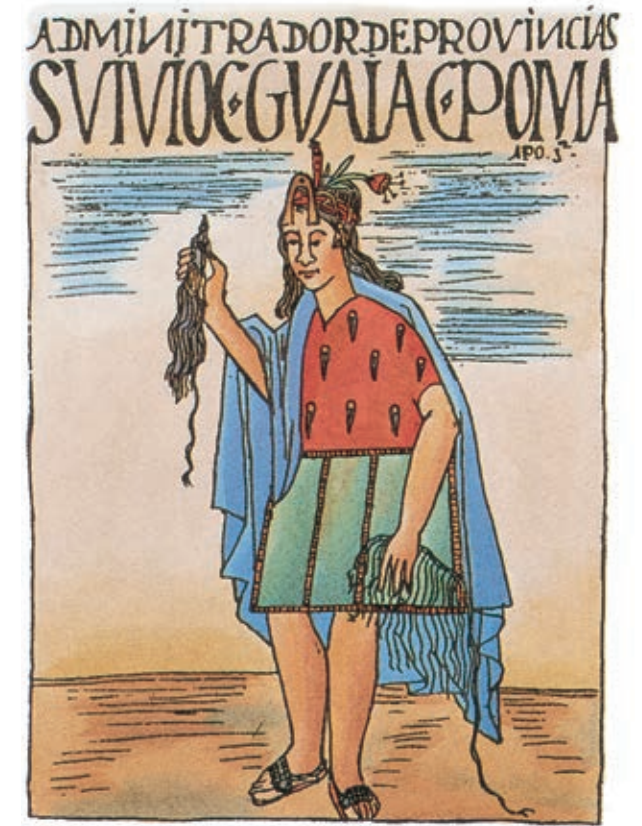
L'AMMINISTRATORE DELL'INCA LA TAVOLA RAFFIGURA UN FUNZIONARIO IMPERIALE CON IL SUO QUIPU, FASCIO DI CORDICELLE USATA PER IL COMPUTO.

Nuove produzioni ed estenuanti ritmi di lavoro sconvolgono secolari ecosistemi di culture ed etnie che non hanno una concezione dell'attività produttiva avulsa da rapporti familiari e sociali e da quel principio di reciprocità che – come nel mondo andino – costituisce il fondamento del legame tra il sovrano inca e i suoi sudditi. In un società in cui scompare il principio della reciprocità e della redistribuzione gli spagnoli assumono la funzione dominatrice e centralizzatrice dell'imperatore inca, ma senza provvedere alla redistribuzione