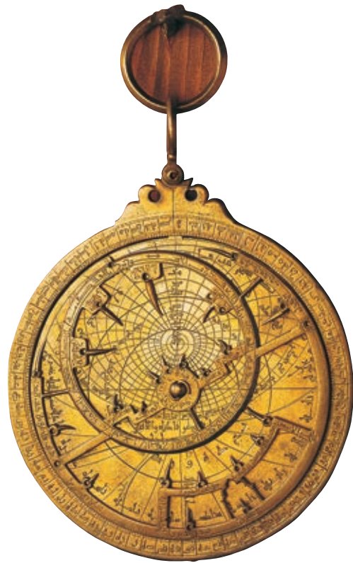
ASTROLABIO ARABO ESPOSTO AL GERMANISCHES NATIONALMUSEUM DI NORIMBERGA.

L'ESPANSIONE PLANETARIA DELL'OC-CIDENTE CRISTIANO SI DEVE, OLTRE CHE A FATTORI DI NATURA DEMO-GRAFICA, SOCIALE ED ECONOMICA, A STRUMENTI IN GRADO DI PERFE-ZIONARE LE TECNICHE DI NAVIGA-ZIONE. QUESTO DISCO DI OTTONE, SU CUI È INCISA UNA PROIEZIONE STEREOGRAFICA DEI CIELI, PER-METTE DI DETERMINARE LA POSI-ZIONE DELLE TERRE AVVISTATE IN RAPPORTO AI CORPI CELESTI. GLI ASTROLABI CONSENTONO DI CALCO-LARE IN MODO APPROSSIMATIVO LA LATITUDINE IN RAPPORTO ALLA PO-SIZIONE DEL SOLE SULL'ORIZZONTE.