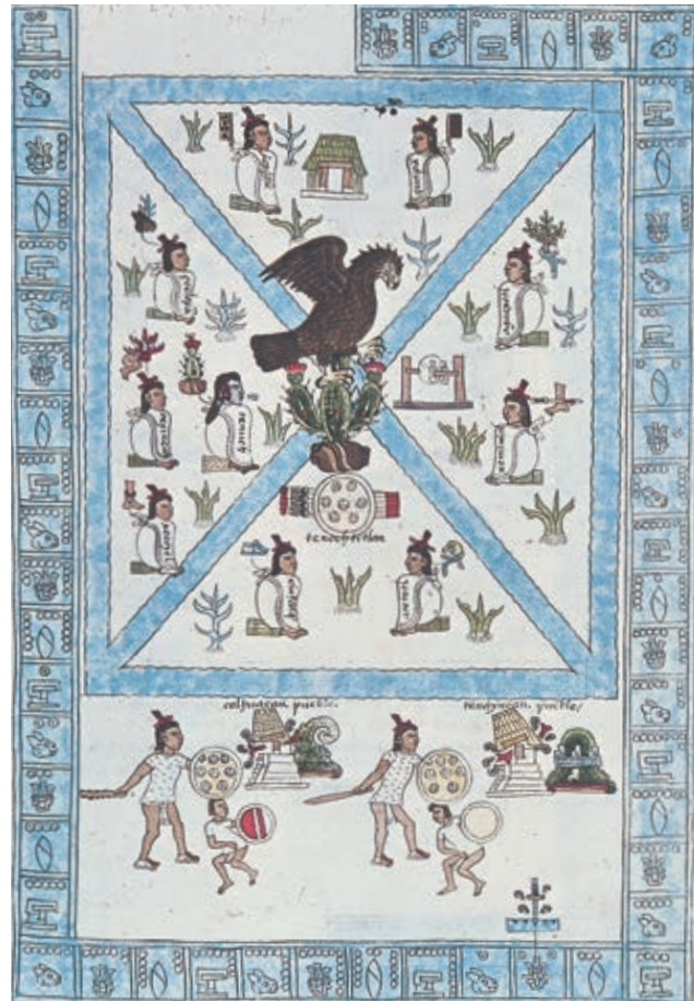
TAVOLA DEL CODICE MENDOZA DELLA PRIMA METÀ DEL XVI SECOLO, OXFORD, BODLEIAN LIBRARY, CHE SECONDO LA TRADIZIONE INDIGENA RAFFIGURA L'ANNUNCIO PROFETICO DEL LUOGO IN CUI GLI AZTECHI AVREBBERO FONDATAO TENOCHTITLAN, CUORE DEL LORO IMPERO. AL CENTRO DELLA TAVOLA È RAPPRESENTATA UN'AQUILA POSATA SU UN FIGO D'INDIA.

INDIOS CON STRUMENTI A FIATO E CON ARCHI E FRECCIE ILLUSTRAZIONE TEDESCA DEL XVI SECOLO, WEIMAR, STAATLICHE KUNSTSAMMLUNGEN.