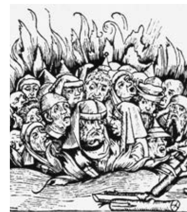
AUTODAFÉ PRESIDUTO DA SAN DOMENICO DI PEDRO BERRUGUETE, (FINE XV SECOLO), MADRID, MUSEO DEL PRADO.

tardi ad abbandonare la penisola. Le conseguenze dell'espulsione di Mori ed ebrei saranno devastanti per l'economia spagnola. A testimonianza della mirabile sintesi culturale della Spagna medievale, resta l'architettura della penisola iberica: una commistione di romanico mediterraneo, di gotico e di ornamenti orientali.