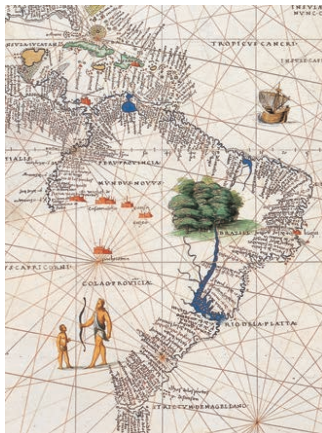
L'AMERICA MERIDIONALE RAFFIGURATA NEL PORTOLANO N. 1, CARTA VI, (1553) DI GIOVAN BAT- TISTA AGNESE, VENEZIA, BIBLIO- TECA DEL MUSEO CORRER.