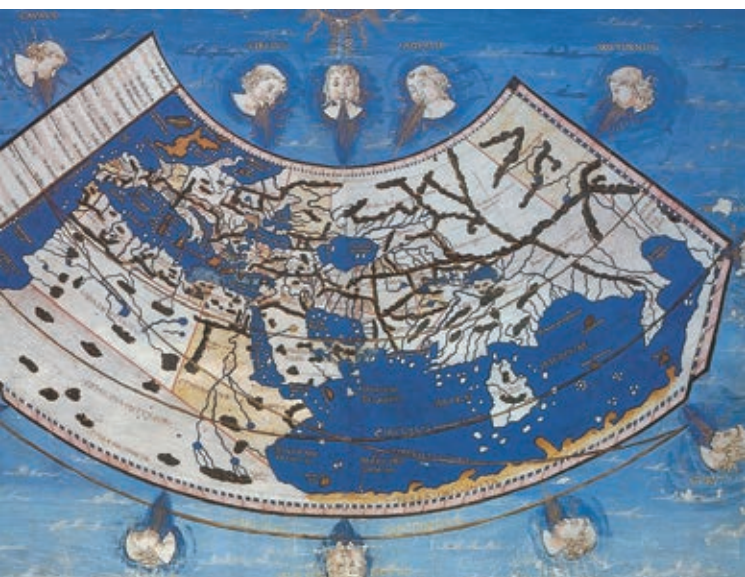
MAPPAMONDO MANOSCRITTO SU CARTA TRATTO DALL’EDIZIONE DELLA GEOGRAPHIA DI TOLOMEO DEL 1466 (CIRCA). L’OPERA, SCRITTA NEL II SECOLO D.C. DALL’ASTRONOMO E GEOGRAFO GRECO, COSTITUISCE LA SUMMA DEL SAPERE CARTOGRAFICO DELL’ANTICHITÀ. LE CARTE CHE CORREDANO LE EDIZIONI BIZANTINE DEL SECOLO XIV SI BASANO SULLE INDICAZIONI CONTENUTE NEL TESTO DI TOLOMEO.

Insieme a questi luoghi immaginari esiste quello reale anche se indefinito dell’Africa, popolato da selvaggi e con flora e fauna insolite e dove la cartografia abbonda di Hic sunt leones . Non certo un luogo di antiche civiltà e di grandi imperi come quello del Gran Khan descritto da Marco Polo, ma di “bar-