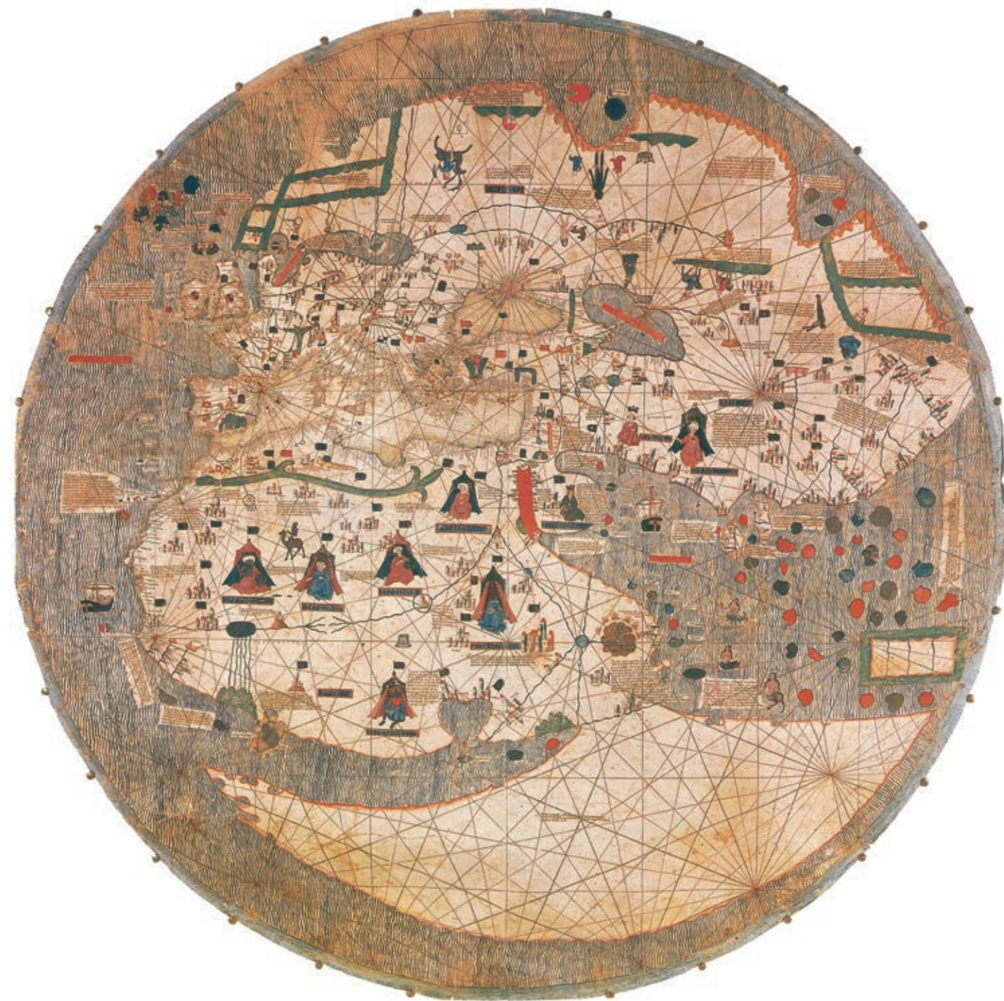
MAPPAMONDO CATALANO QUESTA CARTA MINIATA DELLA FINE DEL XIV SECOLO OFFRE UNA RAPPRESENTAZIONE ABBASTANZA PRECISA DELLE TERRE ALLORA CONOSCIUTE. LA RAFFIGURAZIONE DELL’ASIA SI ISPIRA AL RESOCONTO DI MARCO POLO.