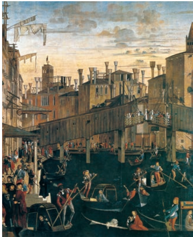
MIRACOLO DELLA CROCE O LIBERAZIONE DELL'INDEMONIATO IL PARTICOLARE DEL DIPINTO DI VITTORE CARPACCIO (1494), VENEZIA, GALLERIE DELL'ACCADEMIA, RAFFIGURA IL TRAFFICO DI IMBARCAZIONI SUL CANAL GRANDE E IL PONTE DI RIALTO.