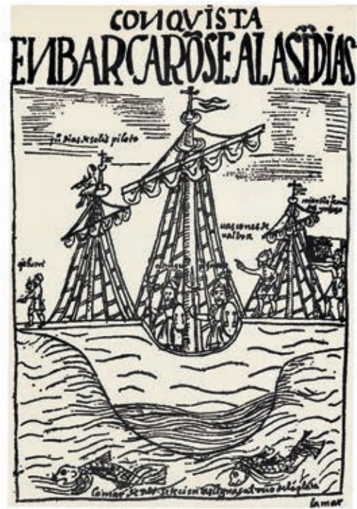
IMBARCO PER LE INDIE ILLUSTRAZIONE TRATTA DA NUEVA CORÓNICA Y BUEN GOBIERNO (1615) DEL METICCIO PERUVIANO GUAMÁN POMA DE AYALA.