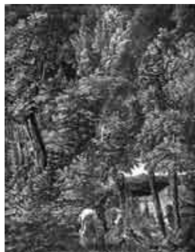
Pier Paolo Pasolini, Accattone (1961) Luis Buñuel, Los Olvidados (1950) Albrecht Altdorfer, Saint George and the Dragon (1510)

Of course this film started as if I was going to do The Godfather in documentary form. But something deeper happened. I had just read Landscape and Memory , by Simon Schama – a very provocative book that deals with the relation between nature, mythology, psychology and identity-building. So I entered this really old, mythical and violent world of Chechnya, with all kinds of codes and meanings, that seemed to be part of mountains and woods.