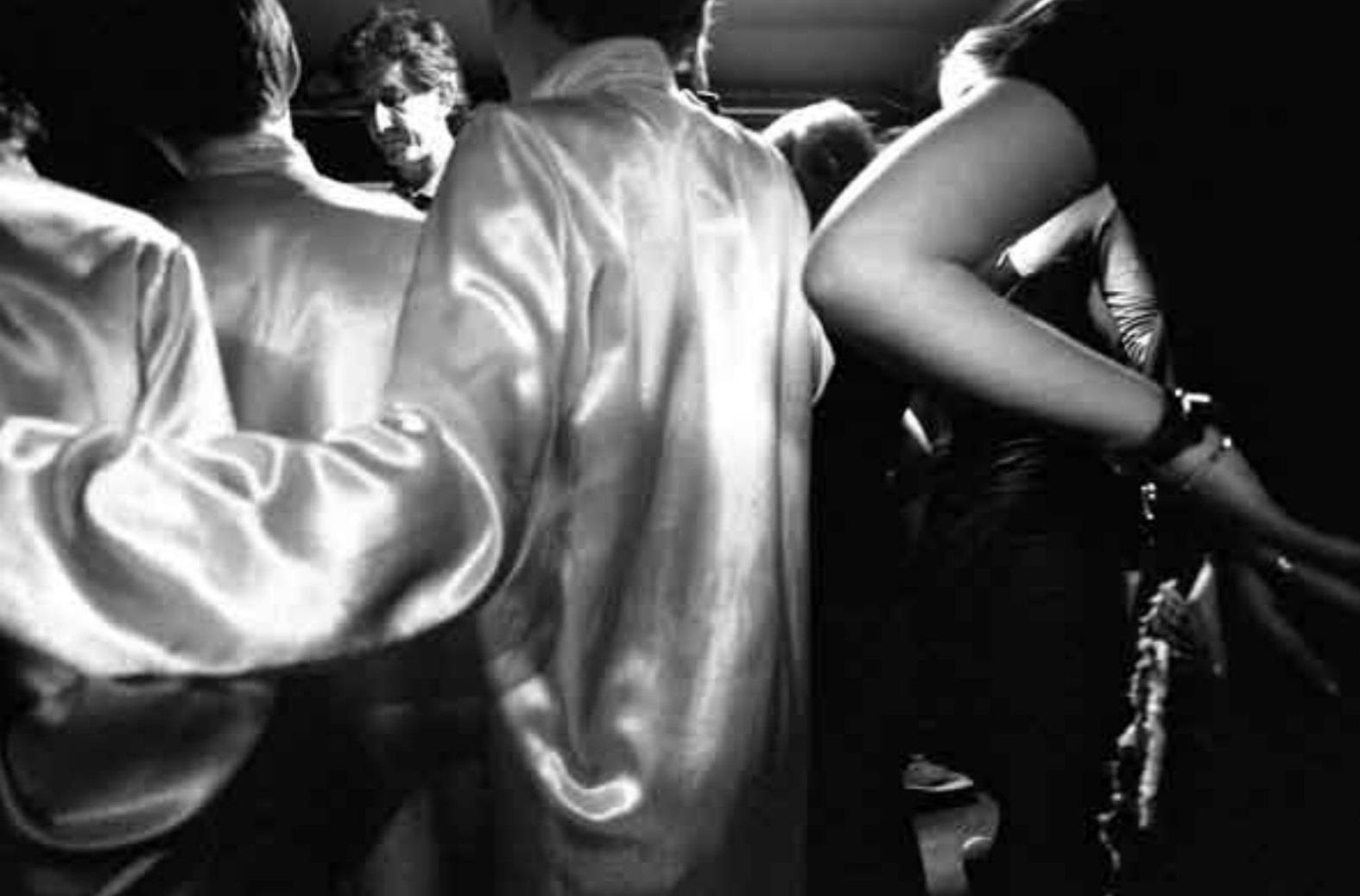
Jos de Putter, Dans, Grozny dans (The Damned and the Sacred)

I film di de Putter, insieme a tante immagini piene di storie, offrono spazi vuoti che si appellano allo spettatore perché trovi il materiale per riempirli. Poggiare lo sguardo sul reale può certo significare aderire al visibile offerto dallo spettacolo del mondo e alle forme di vita in esso divenute egemoni, tuttavia lo sguardo stesso può sempre eccedere il mondo, proprio a partire da quelle zone vuote individuabili nella stessa fitta tela del regime di visibilità vigente [ib.].