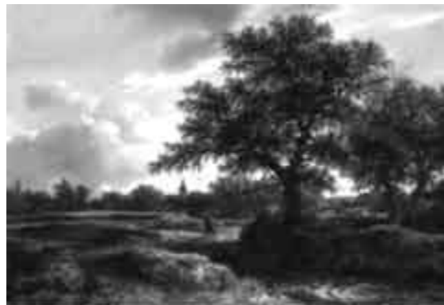
Jacob van Ruysdael, Landscape with a Village in the Distance (1646)