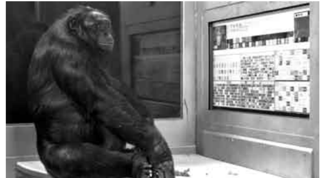
Jos de Putter, See No Evil

From the infant form, the cinema of Jos de Putter preserves simplicity without ever falling into banal. One can access his films without any significant intellectual effort. Almost always, the viewer is taken aback by the immediacy and clear-cut definition of the boundaries of a not yet outlined, but already visible pathway. And yet, nothing will ever be made definitively clear.