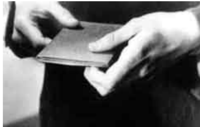
Robert Bresson, Pickpocket (1959)