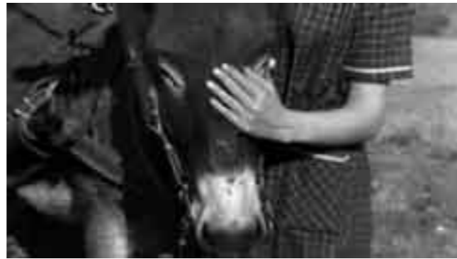
Robert Bresson, Au hasard Balthazar (1966)

Con l'operatore Stef Tjldink abbiamo parlato di come ritrarre i paesaggi. Io ho progressivamente elaborato una teoria: nei dipinti realizzati da pittori cattolici è come se ci fosse "più aria", mentre i protestanti tendono a mostrare "più terra"; è questione di orizzonte. Poiché i contadini protestanti guardano la terra, spesso collochiamo l'orizzonte più in alto.