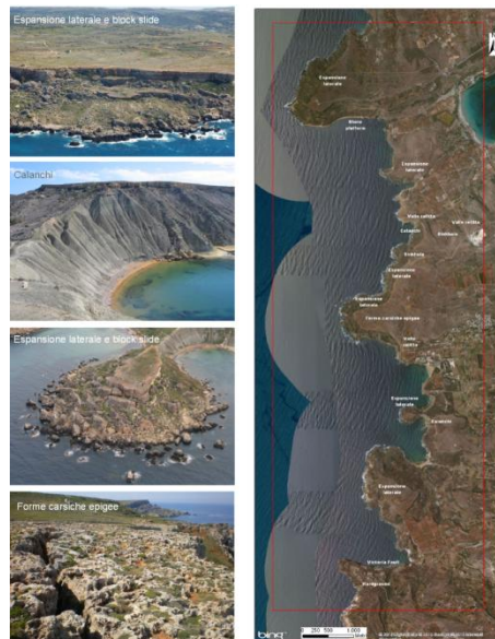
Fig. 2 - Principali forme e processi di interesse geomorfologico che caratterizzano il geosito composito maltese.

Queste forme sono state considerate specialmente per il loro valore didattico, la loro rappresentatività, unicità e rarità e perché rappresentano il risultato dei processi chiave per la comprensione dell'evoluzione geomorfologica dell'area (Bruschi et al., 2011; Coratza et al., 2011).