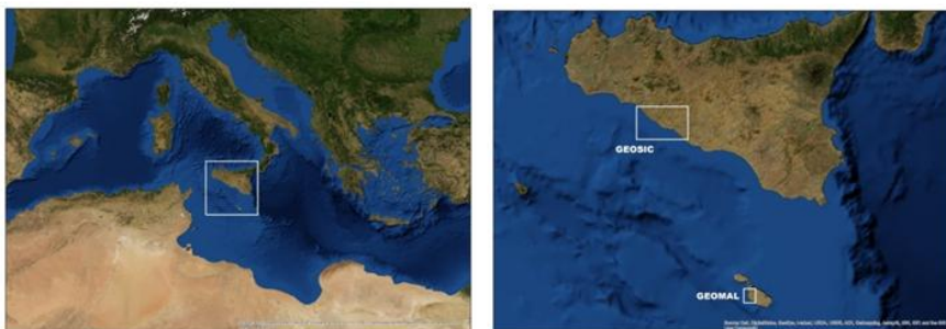
Fig. 1 - Localizzazione delle due aree indagate.