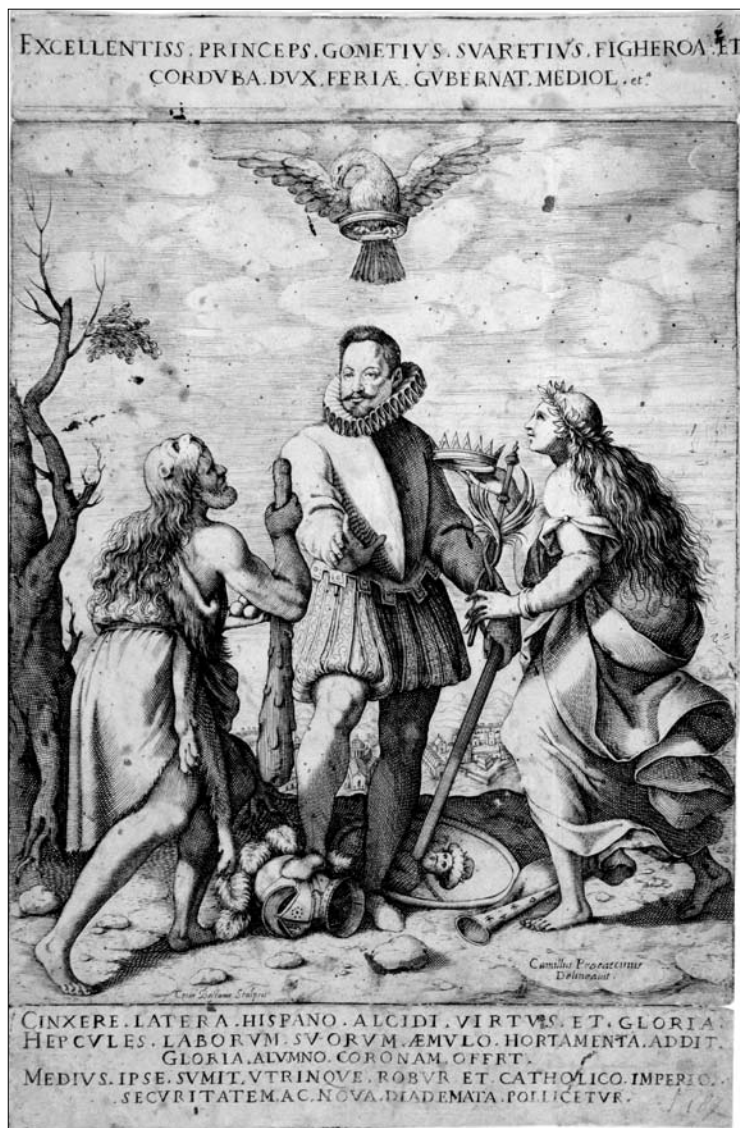
Fig. 2. Ritratto allegorico del duca di Ferra. Incisione di Cesare Bassani da un disegno di Camillo Procaccini (Raccolta delle stampe "A. Bertarelli", Milano).