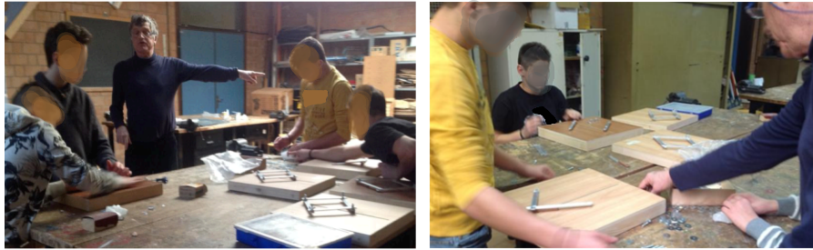
Figura 2 Il lavoro nella falegnameria

Gli allievi si sono impegnati nella falegnameria per quattro ore settimanali durante l'anno scolastico, sotto la guida di un tecnico (Fig. 2). In questo ambiente gli studenti hanno potuto toccare con mano lo sviluppo di una macchina, dalla sua progettazione alla sua realizzazione, incontrando allo stesso tempo tutti i problemi legati al suo funzionamento in relazione a quel che si vuole che la macchina riproduca.