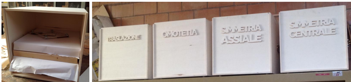
Figura 3 Le macchine realizzate e i loro contenitori

Il lavoro è iniziato a novembre 2014 e si è concluso a fine anno scolastico. Sono state realizzate sei macchine per ogni tipo. Da marzo 2015 il laboratorio ha previsto la costruzione delle scatole di contenimento delle macchine (Fig. 3) mentre l'attività con le macchine stesse è stata effettuata nelle classi e durante le ore del laboratorio di potenziamento di scienze.