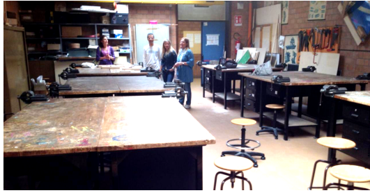
Figura 1 La falegnameria

varie macchine matematiche, sono stati scelti i pantografi per le trasformazioni geometriche (più precisamente, per la simmetria assiale, simmetria centrale, traslazione, omotetia) in quanto corrispondenti a parte dei contenuti di matematica della scuola secondaria di primo grado. Il Laboratorio delle Macchine Matematiche ha fornito le copie che sono diventati i modelli per lo studio e la riproduzione.