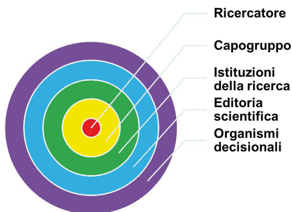
Fig. 2 La figura rappresenta come sono strutturate le gerarchie nella ricerca scientifica.

MIT era quello di dimostrare che conferenze e riviste accettavano spesso lavori privi di senso. Non si erano certo aspettati un successo così eclatante.