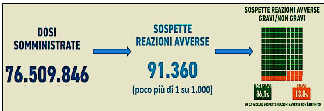
Figura 2. Dati dell’Agenzia Italiana del farmaco dall’ottavo “Rapporto sulla Sorveglianza dei vaccini COVID-19” aggiornati al 26 agosto 2021: dosi di vaccino somministrate, numero e tipologia di sospette reazioni avverse segnalate 16 .

Considerando tutti i vaccini insieme, gli eventi avversi più segnalati sono stati febbre, stanchezza, cefalea, dolori muscolari/articolari, reazione locale o dolore in sede di iniezione, brividi e nausea. Gli eventi avversi correlabili al vaccino ad esito più grave possibile, ovvero quelli che hanno causato il decesso, sono stati in totale 14, pari a 0,2 casi ogni milione di dosi somministrate. Sebbene da un punto di vista freddamente numerico il dato sia molto contenuto, va considerato che ogni caso di decesso andrebbe comunque evitato, e quindi il massimo impegno va dedicato alla prevenzione.